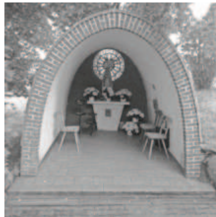
Fotodatei: „Kolpingsgrotte Aixheim.jpg“

Treffpunkt für die Bildung von Fahrgemeinschaften ist am Landratsamt in der Werderstraße um 13.30 Uhr. Start der Pilgerwanderung ist um 14.00 Uhr an der Pfarrkirche St. Georg in Aixheim. Die Teilnahme ist kostenfrei.